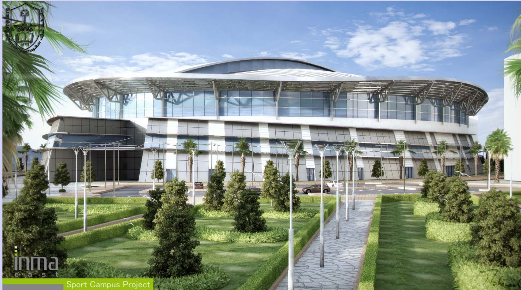
Stade King Saud University à Riyad, Arabie Saoudite Schroeder & Associés S.A. Etudes en cours