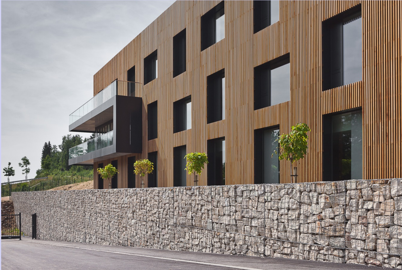
Hôtel à Spa-Francorchamps Moreno Architecture / Schemel & Wirtz / AUPA Réalisation en 2010