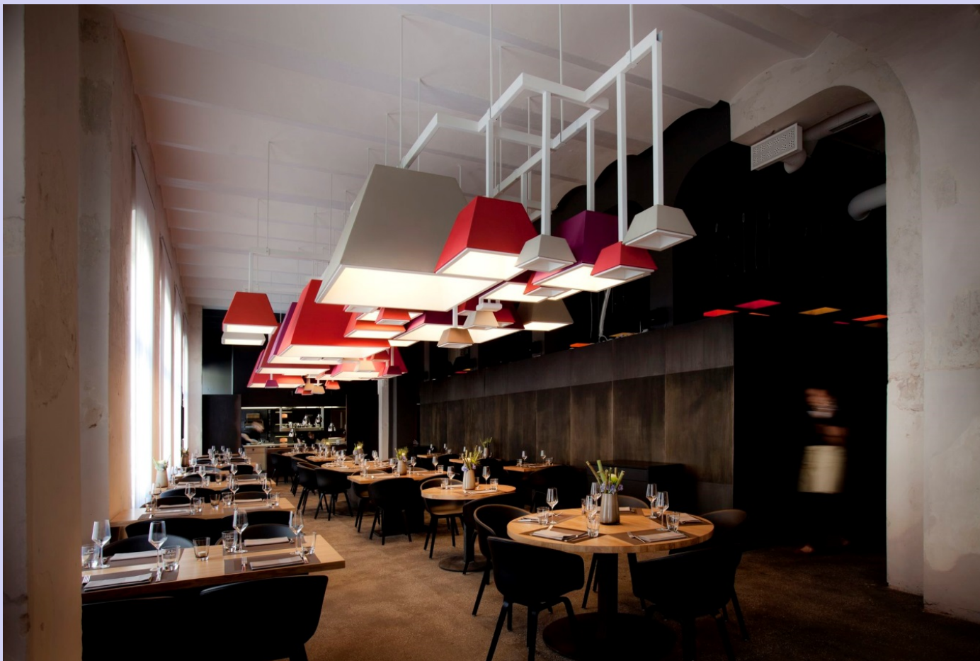
Aménagement intérieur d'un bar restaurant deli à Trèves Jim Clemes, Atelier d'Architecture et de Design Réalisation en 2013