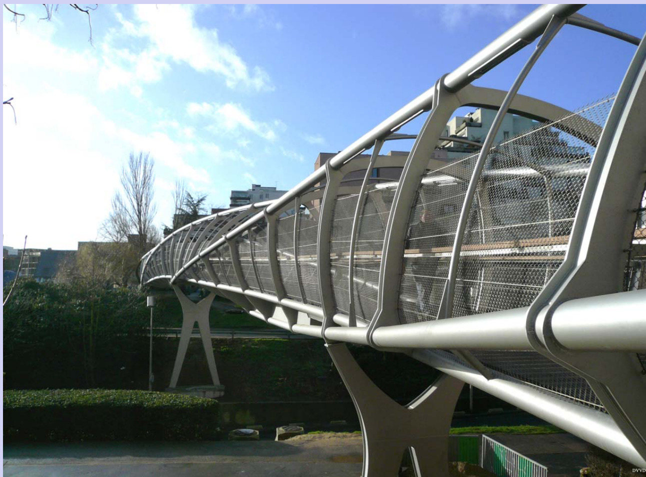
Passerelle « Quai aux Fleurs » à Evry/Paris, France Schroeder & Associés S.A. Réalisé en 2007