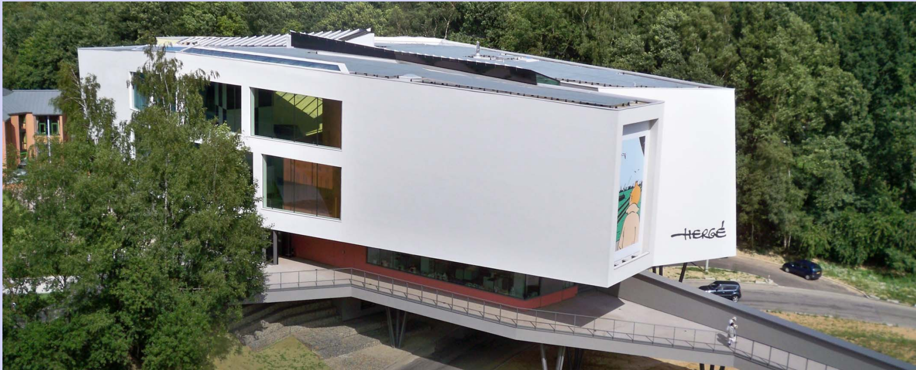
Musée Hergé à Louvain-la-Neuve (B) Project Management et génie civil: INCA Ingénieurs Conseils Associés Réalisation : 05/2007-05/2009