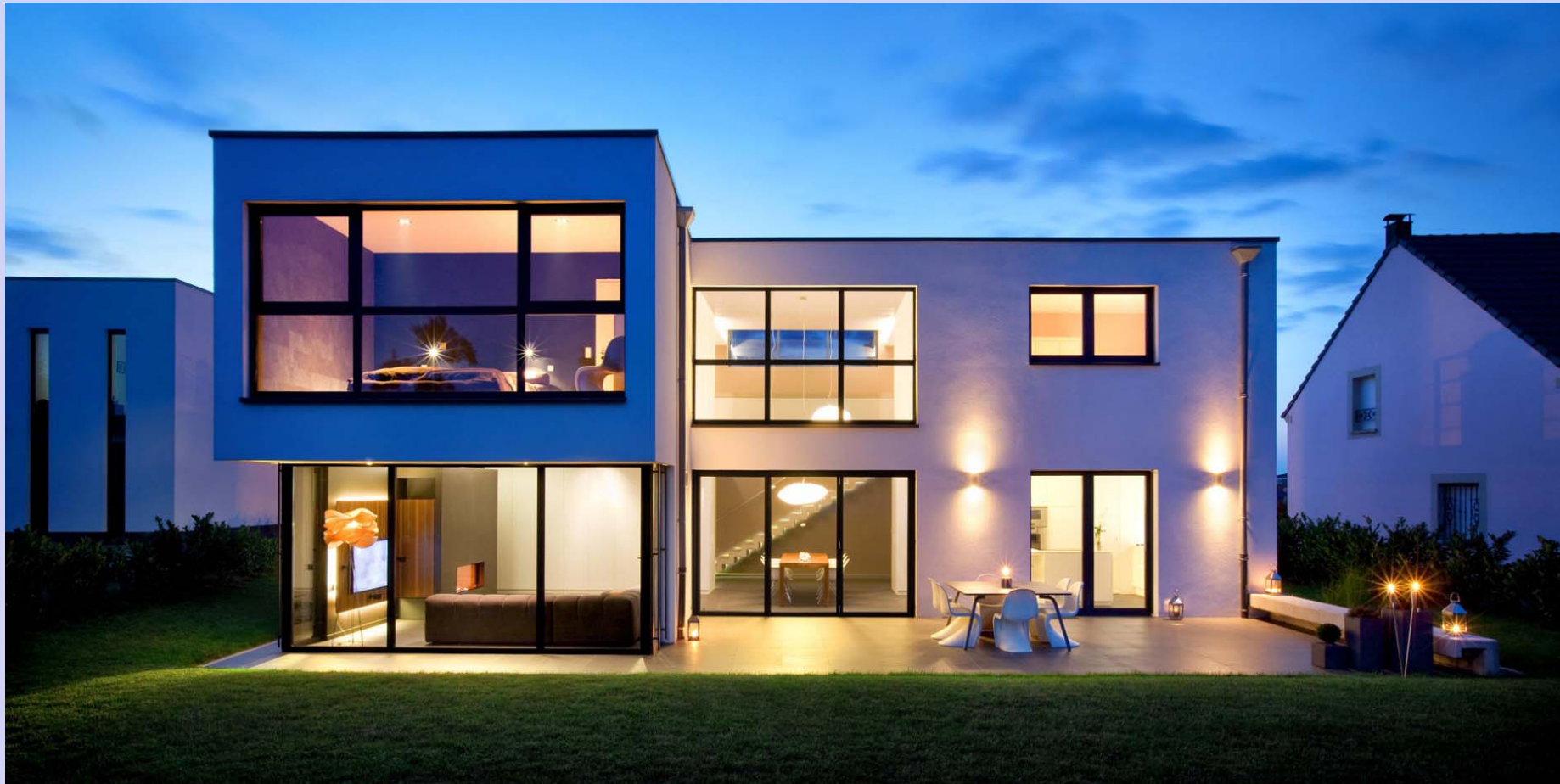
Maison particulière à Hagen, France BENG Architectes Associés Réalisation en 2010