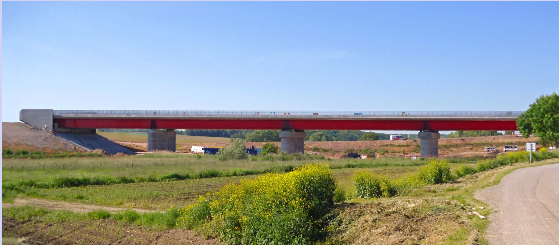
Ligne Grande Vitesse Est Européenne Viaduc du Rohrbach(F) INCA Ingénieurs Conseils Associés Réalisation en 2013