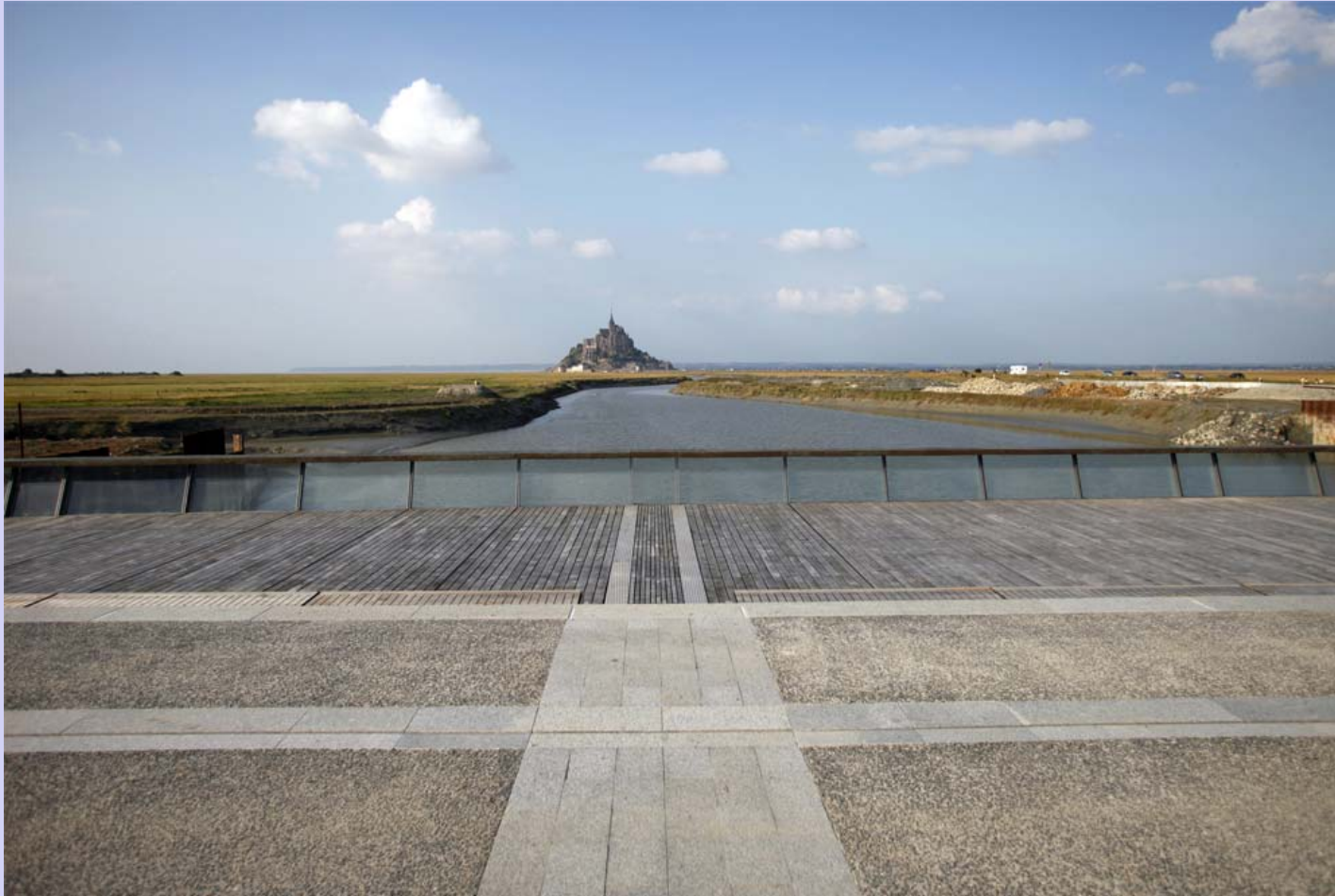
Balcon de la mer, Mont Saint Michel, France Schroeder & Associés S.A. Réalisé en 2009