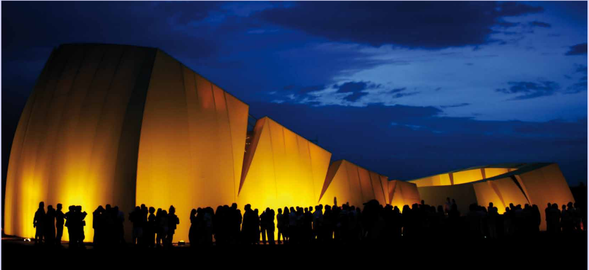
Théâtre pour Trancoso, Bahia, Brésil Valentiny HVP Architects Début de la conception : 2009