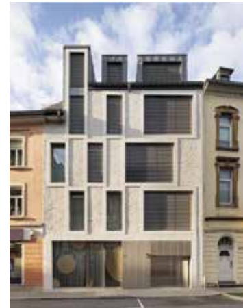
Immeuble mixte PASAM Luxembourg

Architecte(s) : Moreno Architecture & Associés