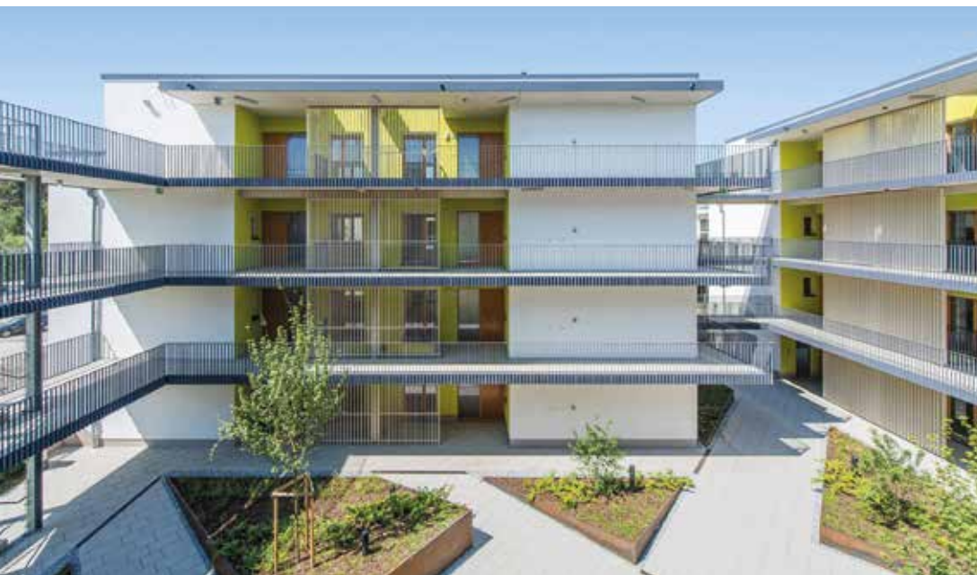
Nonnewisen Lot 7sa, logement collectif Esch-Sur-Alzette

L'OAI proposera des documents-types afin de formaliser cette phase importante et les prestations y afférentes.