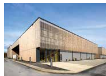
Centres de compétences - Bettendorf

Architecte(s) : Architecture & Urbanisme 21 Yvone Schiltz & Associés