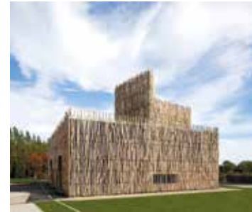
Centrale à biomasse Niederanven

7.3. Le Ministère de l'Intérieur et l'OAI ont publié l'affiche « Fiche de travail - Procédure PAG/PAP », qui contribue à faciliter la compréhension des différentes étapes procédurales. Elle est disponible dans la Médiathèque du site www.oai.lu (3) .