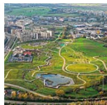
Parc du Ban de Gasperich Luxembourg

Dans le cadre du diagnostic lois / RGD / procédures effectué par l'OAI pour le compte du Ministère des Affaires intérieures, des propositions complémentaires ont encore été soumises pour rendre cet outil encore plus pertinent pour les utilisateurs communaux et les membres OAI. Elles sont reprises dans le paquet de 40 mesures de simplification administrative annoncé le 19 juin 2024 par le Ministre du Logement et de l'Aménagement du territoire, Claude MEISCH, le Ministre des Affaires intérieures, Léon GLODEN, et le Ministre de l'Environnement, du Climat et de la Biodiversité, Serge WILMES.