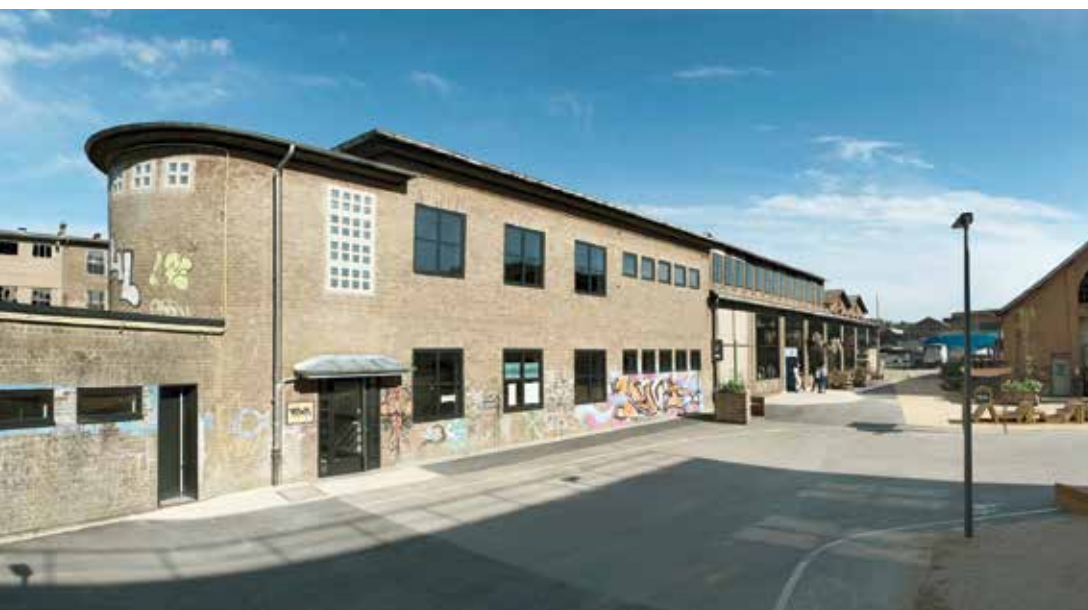
Vewa Espace de Création Dudelange Architecte(s) : MEA - Marx Eric Architecte Ingénieur(s)-Conseil(s) : BEST Ingénieurs-conseils Werkbund © Serge Ecker

8.3. Des séances d'information sur des nouveautés légales et réglementaires, ou encore de présentation de certaines administrations sont régulièrement proposées pour les membres de l'OAI.