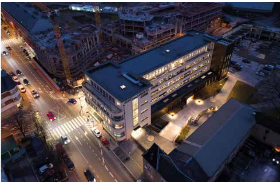
Landewyck Building Luxembourg

Les modalités d'inscription sont disponibles sur le site www.oai.lu à la rubrique « Login membres ».