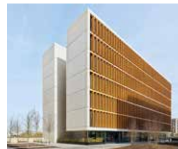
The Bronze Gate Gasperich

Plus d'information sur cette procédure sur www.concursoai.lu !