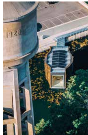
Floater Dudelange Architecte(s) : M3 Architectes Ingénieur(s)-Conseil(s) : TR-Engineering Werkbund © Ville de Dudelange

4.5. L'OAI a mis en place sa plateforme www.concoursoai.lu qui permet de simplifier l'organisation de telles procédures. Le concours « Glamping cabins », organisé en 2022/2023 par le Ministère de l'Economie / Direction générale du Tourisme et l'OAI a été le premier à utiliser cet outil.