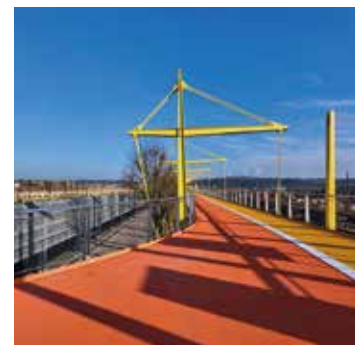
Vélodukt - Esch-sur-Alzette

Des informations complémentaires sur la Maîtrise d'œuvre OAI, et notamment le livre et les fiches de travail, sont disponibles sur www.moai.lu .